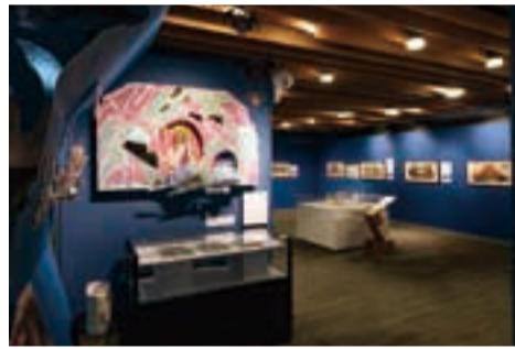
2016年に開館した「藤沢市藤澤浮世絵館」では、東海道の藤沢宿や江の島が描かれた浮世絵などを展示する。

藤沢市藤澤浮世絵館 神奈川県藤沢市辻堂神台2-2-2 ココテラス湘南7F TEL 0466-33-0111 ◎10時～19時(入館は18時30分まで) Ⓜ月曜(祝日の場合は翌平日)