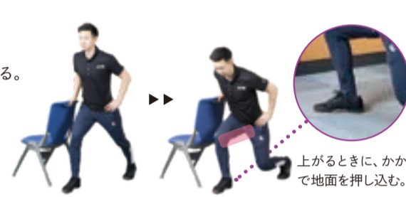
上がるときに、かかとで地面を押し込む。

重心は前足のかかとに8割、後ろ足に2割。膝とつま先の向きは一緒になるように。体を少し前傾させる。椅子の背につかまって行っても。