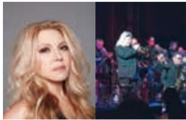
イリアヌ・イリアス(左)、ブルーノート東京 オールスタージャズ・オーケストラ directed by エリック・ミヤシロ(右)

「かわさきジャズ」のミューザ川崎公演、まず注目は、10/26(木)に「ドラムスの神様」スティーヴ・ガッドがトリオで降臨。レジェンド達による特別な夜が幕を開ける。最終日の11/19(日)にはブラジル音楽の美しき至宝イリアヌ・イリアスと、日本を代表するトランペッター、エリック・ミヤシロ率いるオールスタージャズ軍団が集結する。コンサートホールならではの極上サウンドを堪能したい。