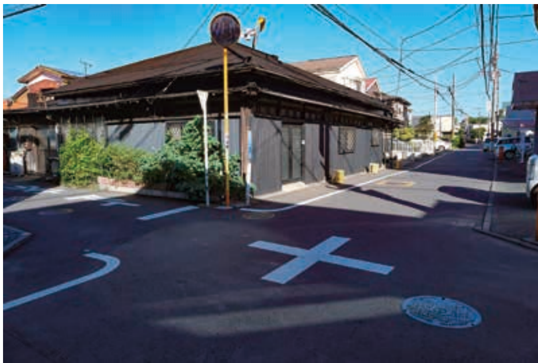
辻堂は、源頼朝により勧請されたという宝泉寺付近が村の始まりとされ、この四つ角はかつての辻堂の中心地と言われている。