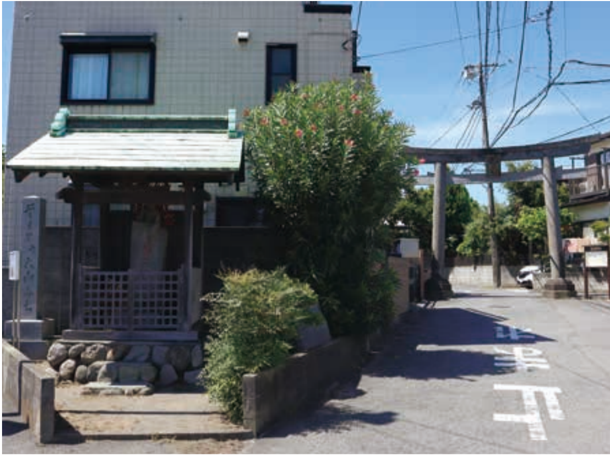
大山道と東海道が交差する四ツ谷辻。延宝4(1676)年に建てられた不動堂と、昭和34(1959)年に再建された大山阿夫利神社の一の鳥居(右奥)。