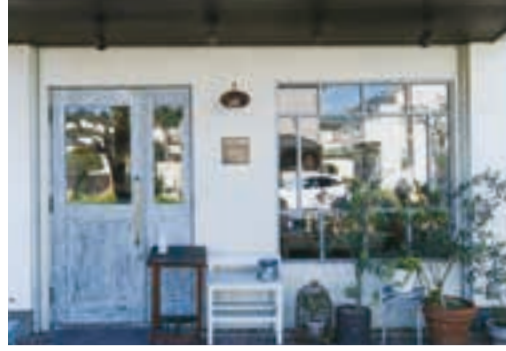
可愛い店構えが目を引く「カフェヒュッテ」。

カフェヒュッテ 神奈川県藤沢市辻堂6-3-10 TEL 0466-41-9067 ◎11時～15時30分(L.O15時)、土日祝は11時～16時30分(L.O16時) ☎火曜