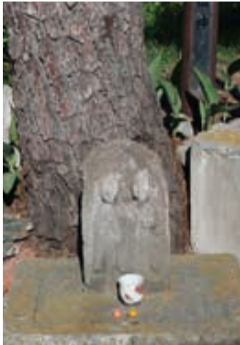
鎌倉往還の途中にあるY字路。大きな松の木の根元にある道祖神。

みかん専門店「柑熟屋」のカフェスタンドでは、季節ごとに種類の異なる柑橘を使った100%生しばりジュース(8、9月を除く)やソフトクリームなどを楽しめる。