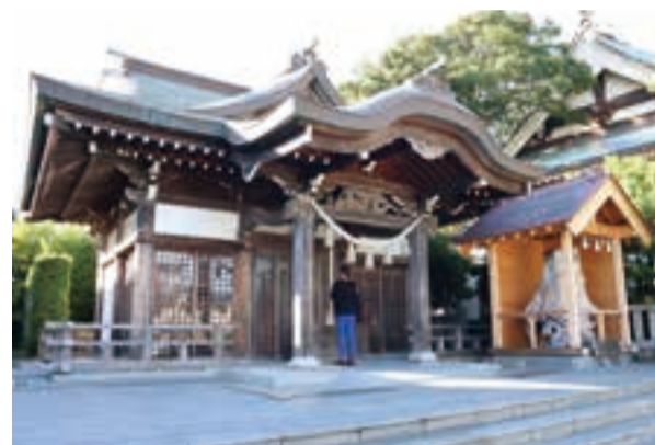
宝泉寺と境内を接する諏訪神社。毎年7月26、27日に催される例大祭の日には、町中が活気に溢れる。