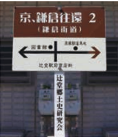
相模川に架かる橋の法要供養に参列した源頼朝は、その帰り道に落馬。それが元で翌年に死去したと言われる(右)。鎌倉と京都を結んだ古道「鎌倉往還」を示す看板(左)。