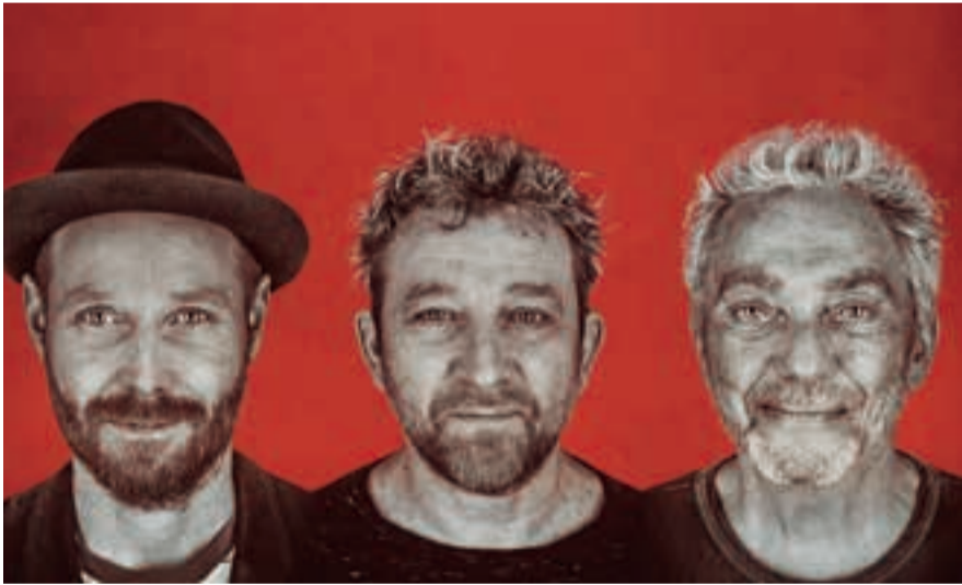
左から、ミカエル・フリチャー、ダン・ヘマー、スティーヴ・ガッド

「かわさきジャズ」のミューザ川崎公演、まず注目は、10/26(木)に「ドラムスの神様」スティーヴ・ガッドがトリオで降臨。レジェンド達による特別な夜が幕を開ける。最終日の11/19(日)にはブラジル音楽の美しき至宝イリアヌ・イリアスと、日本を代表するトランペッター、エリック・ミヤシロ率いるオールスタージャズ軍団が集結する。コンサートホールならではの極上サウンドを堪能したい。