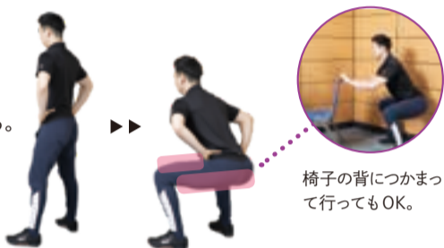
椅子の背につかまって行ってもOK。

おしりをしっかり後ろに突き出すこと。重心の7割はかかとに、つま先と膝は同じ向きに。