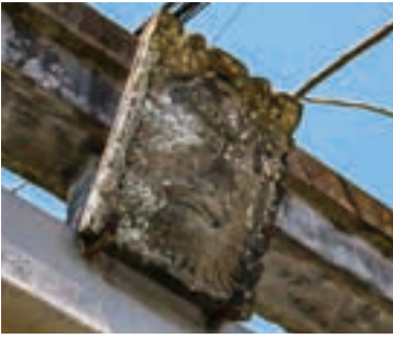
額東には、天狗信仰が盛んだった大山を象徴する天狗の面が掲げられている。