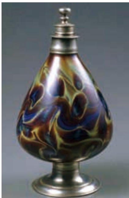
「マーブル・ガラス・デカンター」 16~17世紀 ヴェネチア 箱根ガラスの森美術館所蔵

当館所蔵の「マーブル・ガラス・デカンター」も光に透かすと赤く色が変わる輝変ガラスである。ルネサンス期ヴェネチアのガラス職人が、技術力をもって自然の神秘に挑戦した奇蹟を見せてくれる作品の一つといえるだろう。