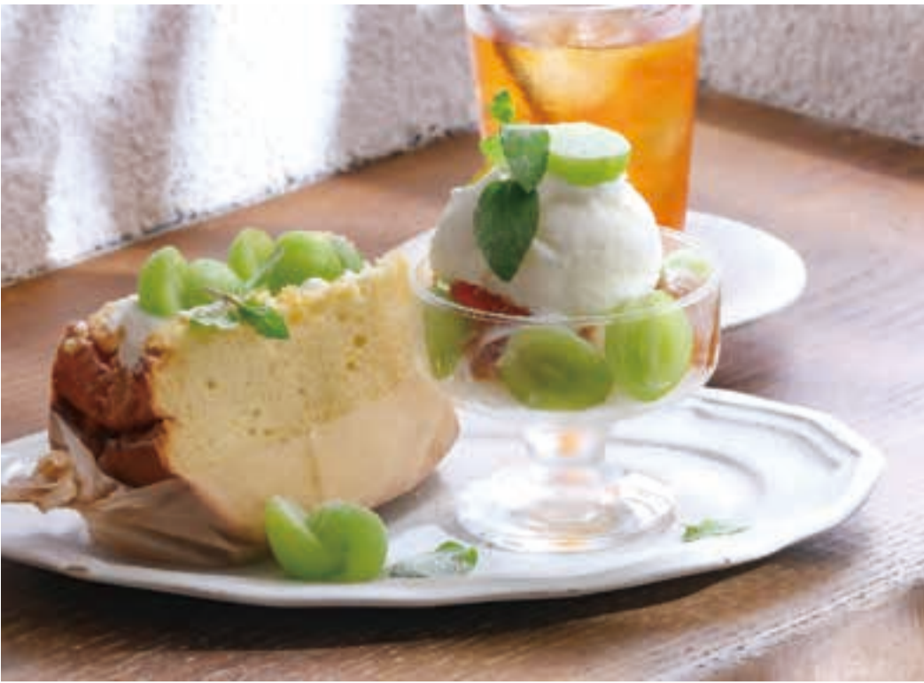
週末限定のシャインマスカットのパフェ(950円)とシャインマスカットのシフォンサンド(780円)。 ※メニューは季節により変動